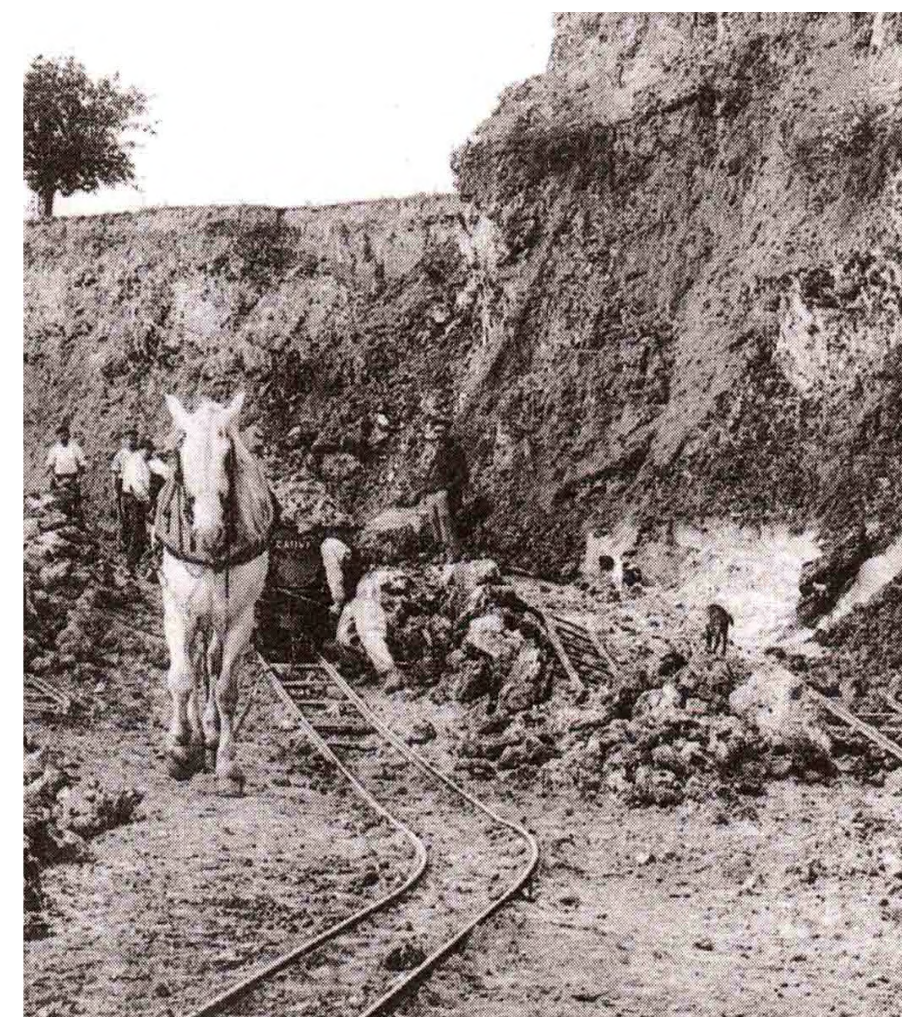
EXTRACTION DE LA MEULIÈRE DE LA CARRIÈRE DE VILLEJUST (ESSONNE) EN 1905-1910.

- LES CALCAIRES DE BRIE : LA MEULIÈRE DE BRIE (D'ÂGE SANNOISIEN, 37 MILLIONS D'ANNÉES), EN DESSOUS DE CES SABLES.