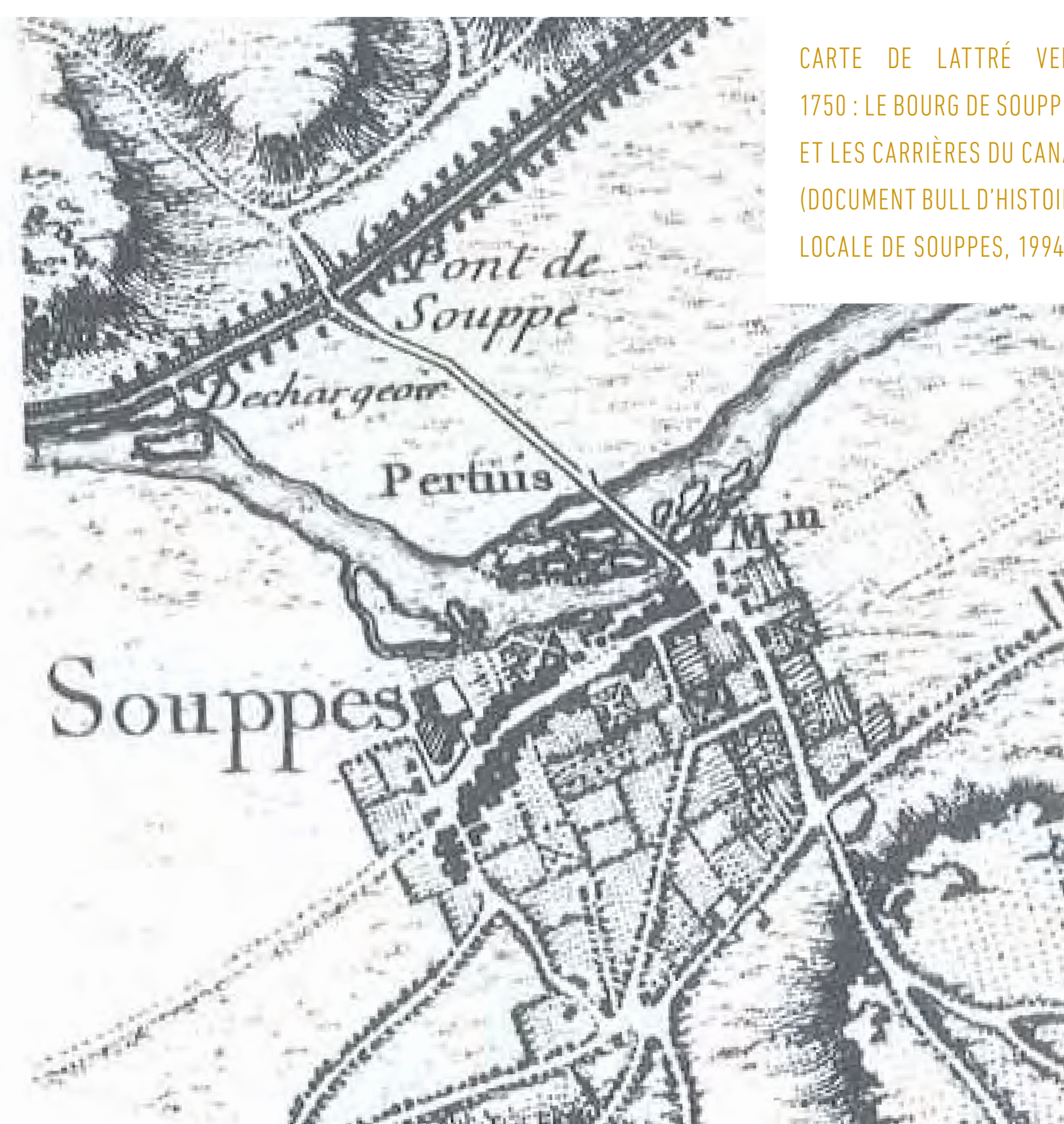
CARTE DE LATRÉ VERS 1750 : LE BOURG DE SOUPPES ET LES CARRIÈRES DU CANAL (DOCUMENT BULL D'HISTOIRE LOCALE DE SOUPPES, 1994)

DÉVELOPPEMENT DE L'EXPLOITATION DU CALCAIRE ET DE SON TRANSPORT PAR VOIE FLUVIALE GRÂCE AU CANAL DU LOING, D'OÙ LE NOM DE CARRIÈRE DU CANAL À SOUPPES