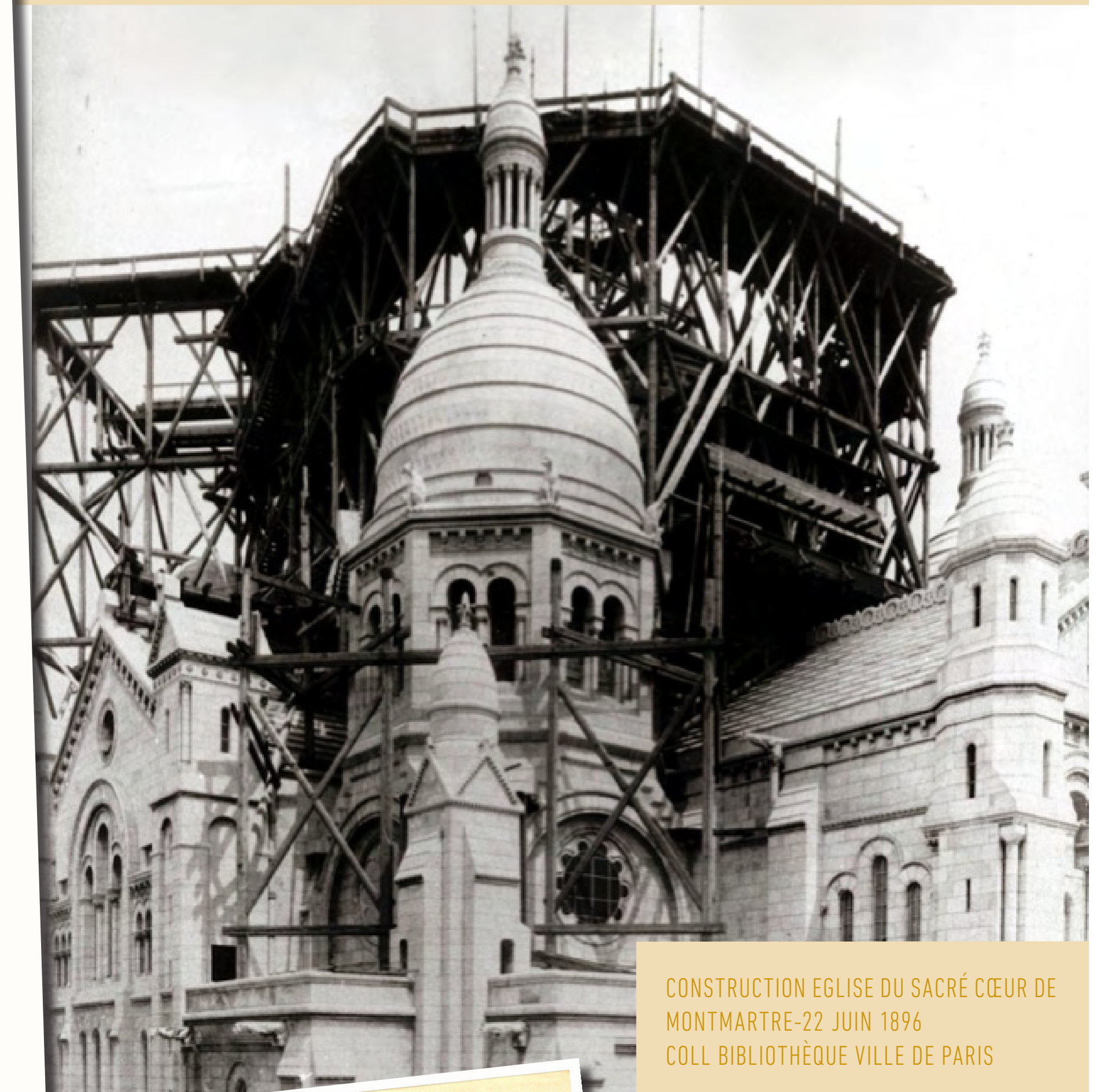
CONSTRUCTION EGLISE DU SACRÉ CŒUR DE MONTMARTRE-22 JUIN 1896

FOURNITURE DES PIERRES DES « CARRIÈRES DU GOUVERNEMENT » DE CHÂTEAU-LANDON ET DE SOUPPES-SUR-LOING POUR DE TRÈS NOMBREUX MONUMENTS PARISIENS.