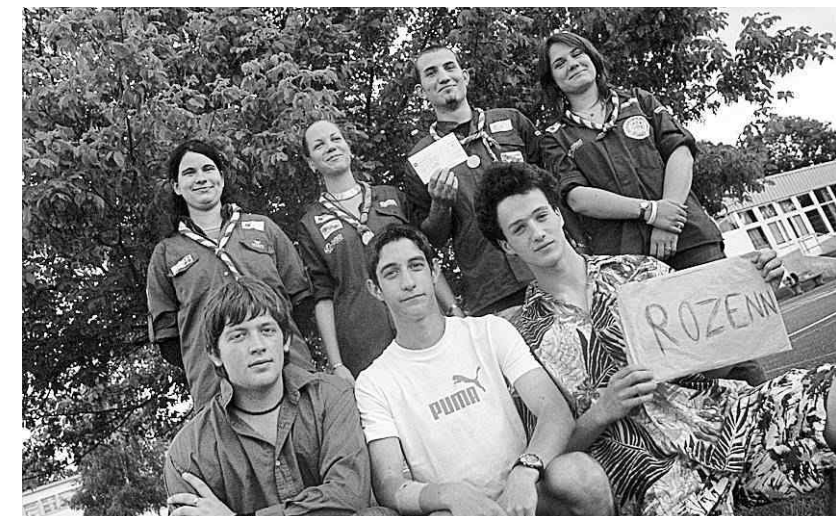
Le lycée Saint-Joseph a remis, hier mardi, un chèque de 813 € à la compagnie lamballaise des scouts et guides de France. Cet argent va permettre aux compagnons de pouvoir préparer leur voyage humanitaire au Togo prévu cet été.

813 € pour les scouts et leur voyage au Togo