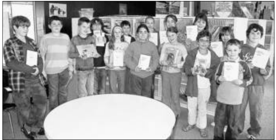
Cette première participation au prix littérature jeunesse « Les Incorructibles » a satisfait les élèves et les enseignants.

Pour donner un sens à leur lecture, conserver une trace de leur travail et consigner leurs impressions, les élèves se sont appuyés